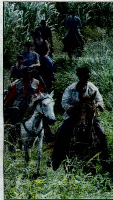
Les randonnées s'adaptent aux envies et au niveau de chacun.

Ecurie Therméa : 0692 21 59 21. Retrouvez toutes les adresses sur ffe.com ou reunion.fr .