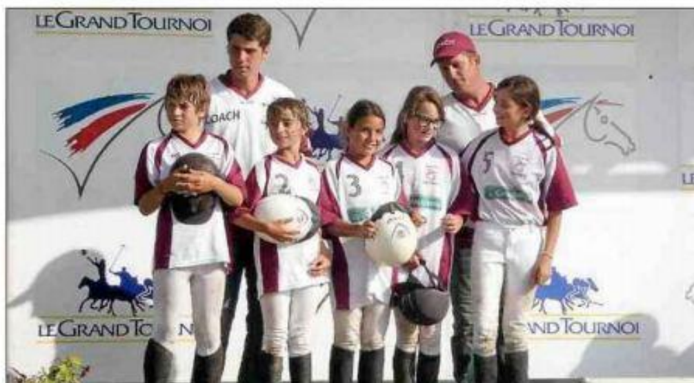
■ Les benjamins N5 ont décroché une médaille d'argent au championnat de France de horse-ball.

Trois médailles nationales obtenues en horse-ball.