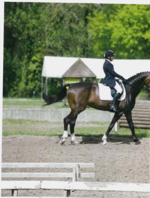
Concours de dressage à Nogent-sur-Eure.

étaient plus jeunes. » Quant à ceux qui ont commencé plus tôt et qui disposent de solides bases, ils se tournent vers des disciplines sportives comme le saut d'obstacles, le concours complet ou bien le TREC (épreuve de pleine nature visant à évoluer les qualités du couple cavalier/cheval). Toujours est-il que la notion d'évasion est leur principale motivation. La Transbeauce, randonnée équestre de faible difficulté qui relie Chartres à Orgères-en-Beauce, invite d'ailleurs à découvrir la beauté des paysages. Elle rassemblera de nouveau, le 14 juin prochain, beaucoup d'amateurs.