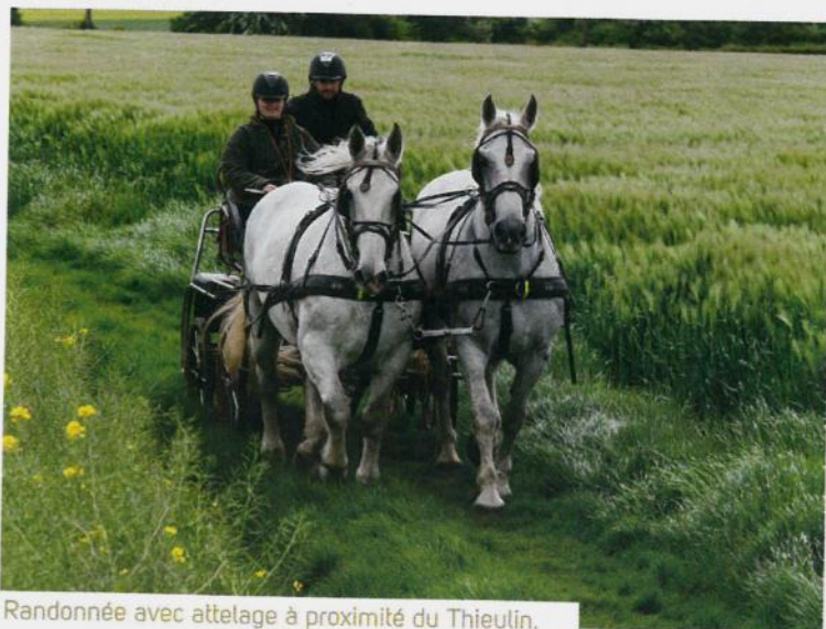
Randonnée avec attelage à proximité du Thieulin.

“ Les adultes et les seniors préfèrent les disciplines qui proposent un contact avec la nature et l'animal ”