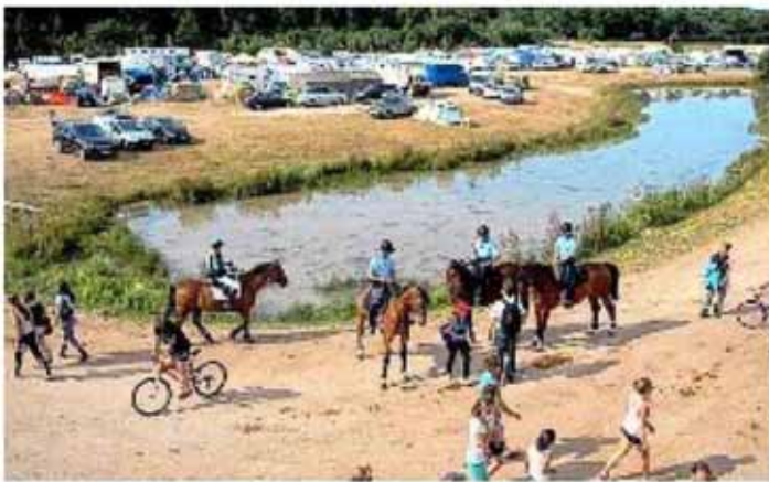
L'escouade de gendarmerie de la garde républicaine patrouille sur les 120 hectares du Generali.

La garde républicaine et une brigade équestre de la Croix-Rouge sont présentes sur le championnat de France d'équitation à Lamotte-Beuvron.