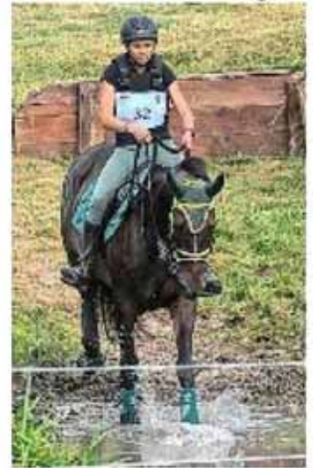
Attention au passage du gué. Les cavaliers sont prévenus.