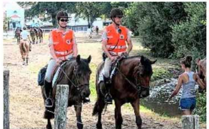
Depuis cet été, une brigade équestre de la Croix-Rouge sillonne les allées du parc afin de repérer et de soigner les personnes en difficulté.

équestre de la Croix-Rouge vient également renforcer l'action de prévention sur le parc. Ils sont quatre cavaliers à patrouiller dans les allées aidés de leur double compétence de cavalier et de secouriste. « Nous avons déjà testé cette brigade l'an passé, cette année la présence est officielle. Comme pour les gardes républicains, nous avons un meilleur point de vue depuis le cheval que ceux qui restent au sol. Notre mission est aussi la prévention et notamment des risques liés à la chaleur et au soleil. Nous rappelons aux cavaliers imprudents la bonne tenue pour éviter les accidents, l'indispensable bombe, ne pas