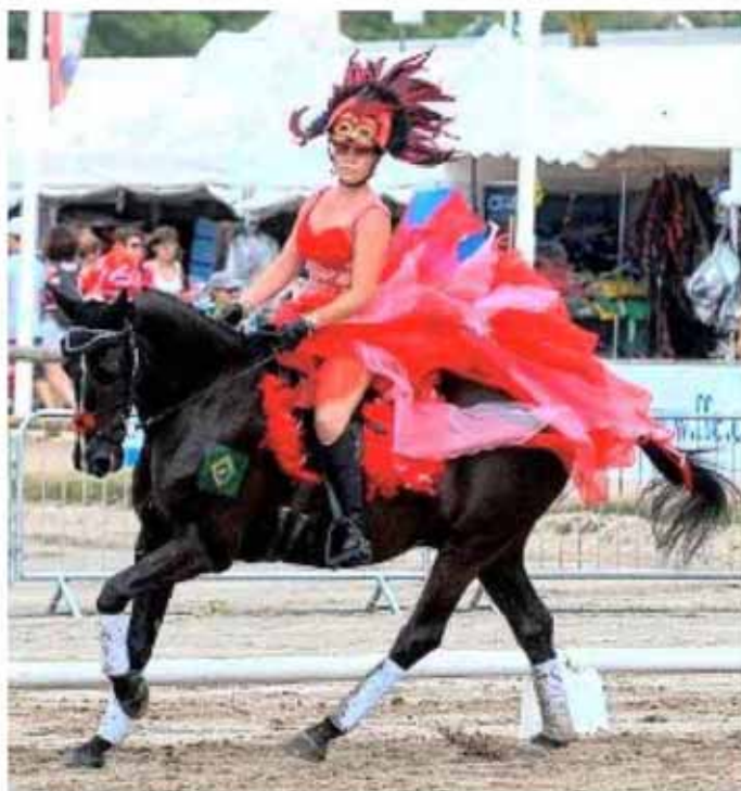
Un couple cheval-cavalier tout feu, tout flamme.