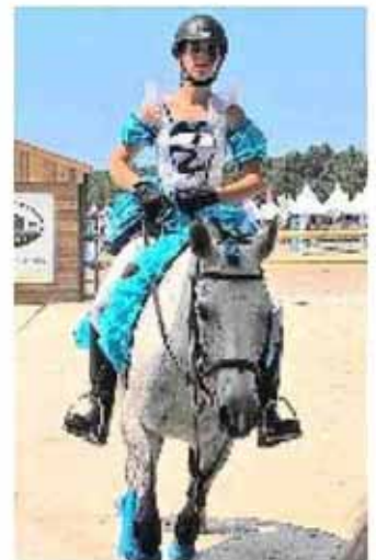
Originalité et compétition font bon ménage au Generali.