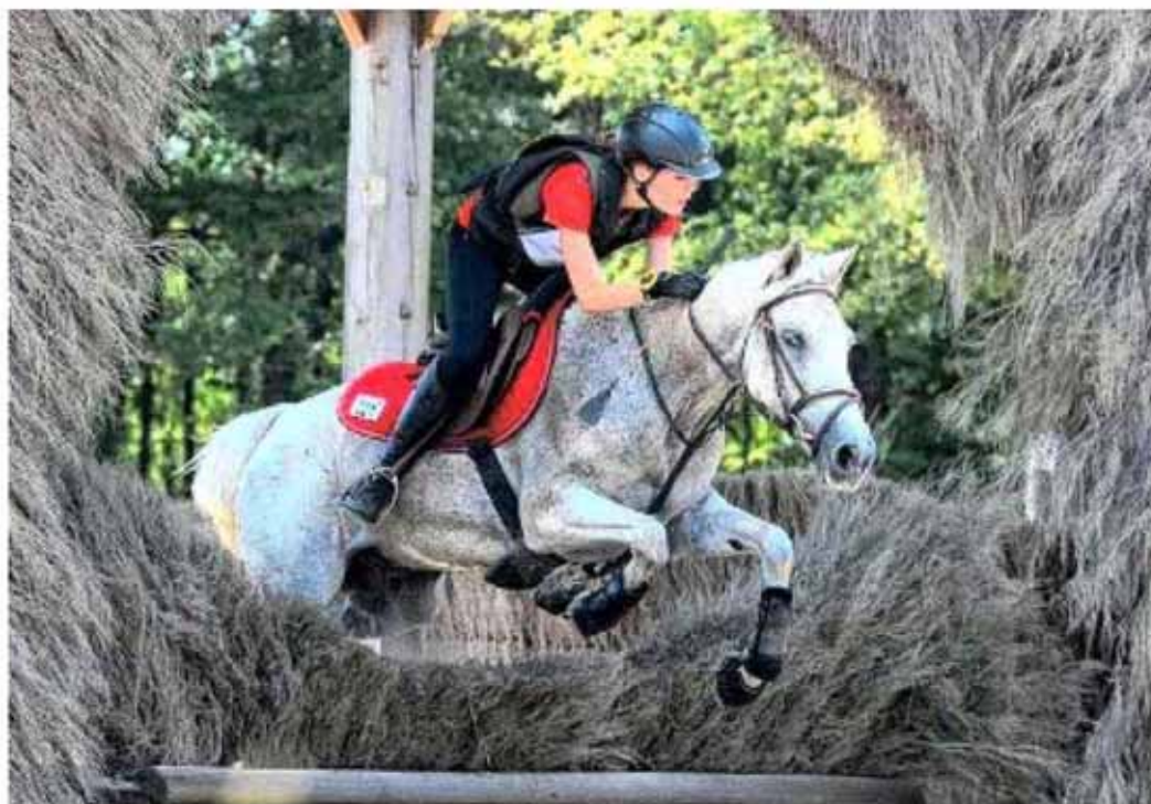
Mieux vaut bien viser pour éviter de chuter...