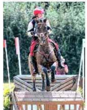
L'enchaînement des obstacles demande de la concentration.

Le Generali Open de France Clubs a encore accueilli plus de 7.000 cavaliers cette année.